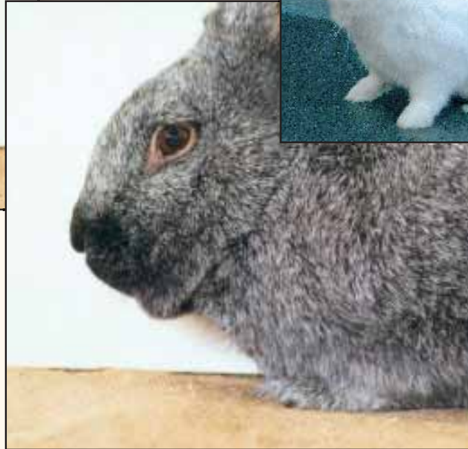
Ram met kinknobbel of knoop onder de kin. ►