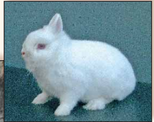
Pooltje met haarstuwing onder de kin. ►