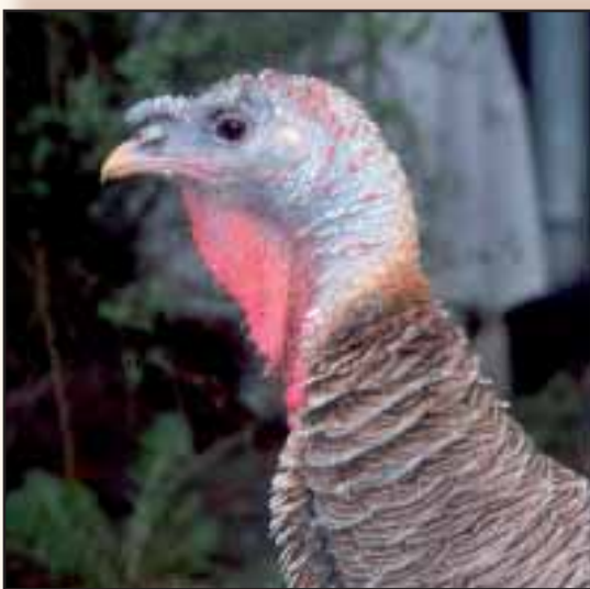
Fraaie hennenkop met zeer mooie blauwe kop huid en blauwe snavelbasis.

Rond 1900 verscheen de Ronquières ook op de toenmalige pluimveetentoonstellingen. Om evidente redenen werd het ras 'Dindon de Ronquières' genoemd, hoewel ze in feite in heel België en Nederland verspreid waren. In 1907 werd door de toenmalige standaardcommissie een standaard opgemaakt maar deze omvatte slechts twee kleurslagen, nl de 'rosse' en de 'bruine'. Louis Vander Snickt sr., een zeer belangrijk figuur in onze vaderlandse pluimveegeschiedenis protesteerde hier fel tegen. Er bestonden immers meerdere kleurslagen die te Ronquières gefokt werden, meestal wel door elkaar. Zo wilde hij, jammer genoeg tevergeefs, dat ook de witte met zwarte zoming dewelke hij reeds in 1899 beschreef, zou erkend worden. In 1905 bezorgde Vander Snickt trouwens nog een aantal van deze dieren aan Alfred Beeck, de directeur van het proefstation van Halle-Cröllwitz in Duitsland. Deze laatste zonder succes getracht om een zwaardere vleeskalkoen te fokken met de tekening van de Ronquières. Echter zijn kruisingsproduct is wel wereldbekend geworden onder de benaming 'Cröllwitzer', maar in feite gaat het dus om een oude kleurslag van de Ronquières. Na WO I was de Ronquières in ons land eigenlijk verdwenen en is het gedurende tientallen jaren helemaal stil geweest rond deze kalkoen.