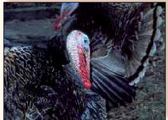
Sterk contrast van felrode kopwratte op blauwe kop huid.

Ook in het buitenland is er intussen wel wat interesse ontstaan in de patrijzen Ronquières. In Nederland en Frankrijk zijn ze intussen ook erkend en worden ze af en toe geshowd. In Duitsland zijn ze in de tachtiger jaren ter erkenning voorgesteld onder de benaming 'Krefelder'. Gelukkig is deze procedure nooit afgerond en wordt de patrijs niet zoals zijn broer de hermelijn geclaimd als zijnde een Duitse creatie. Ook in andere landen zijn ze in de loop der jaren opgedoken en hebben ze een naam gekregen, bv Tacchino Brianzolo in Italië. In deze landen zijn ze echter nooit doorgefokt en gebracht als een eigen ras. Momenteel heeft men ze in de Verenigde Staten ontdekt en tracht men ze in te voeren onder de naam 'Sweetgrass' maar wij weten wel beter. In België komt deze kalkoen al eeuwen voor en in 1907 bestond er al een officiële standaardbeschrijving van. Misschien moeten we trachten ze dit keer ook in het buitenland te promoten en trachten te verspreiden zodat de kans dat ze nog eens opnieuw verdwijnen veel kleiner wordt.