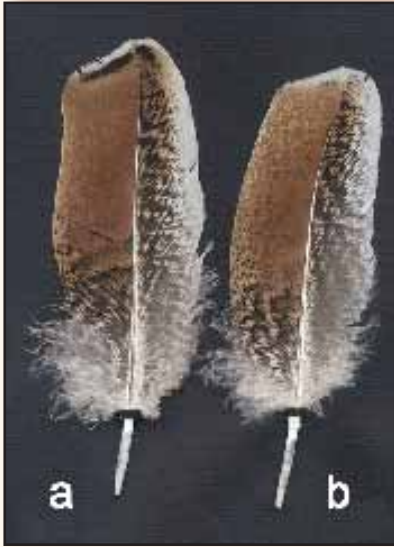
a zeer goed getekende grote vleugeldekveer (spiegelveer) hen, b zwarte subterminale zoming ontbreekt.

is echter de meervoudige tekening op het lichter gekleurde veerveld wel zichtbaar. In de halskraag moet de meervoudige zoming altijd zichtbaar zijn. Er wordt naar gestreefd om ook een fijne witte eindzoming (zilverzoom) op deze veren te verkrijgen maar meestal laat dit te wensen over.