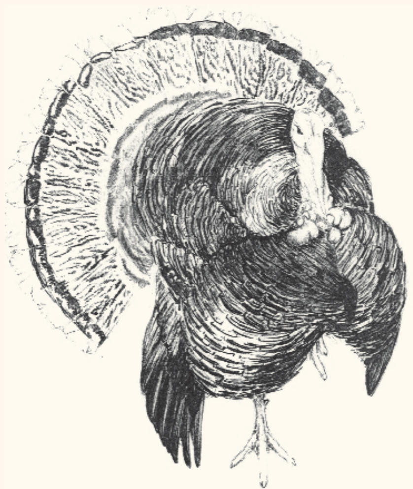
Pronkende haan. Stamvader uit 1993. Potloodtekening van B. Goddeeris.

Pas in de zestiger jaren werden Cröllwitzers uit Duitsland ingevoerd naar Wallonië en opnieuw tentoongesteld als Ronquières en als bijkomende kleurslag aan de standaard toegevoegd. Begin jaren negentig waren deze kalkoenen, toen officieel nog 'gespikkelde' algemeen verspreid in België. Ook de 'rosse' of 'vale' werd regelmatig tentoongesteld maar het betrof steeds kruisingen slechte Rode Ardenners, de naam Ronquières onwaardig. De 'bruine' waren reeds decennia uitgestorven gewaand.