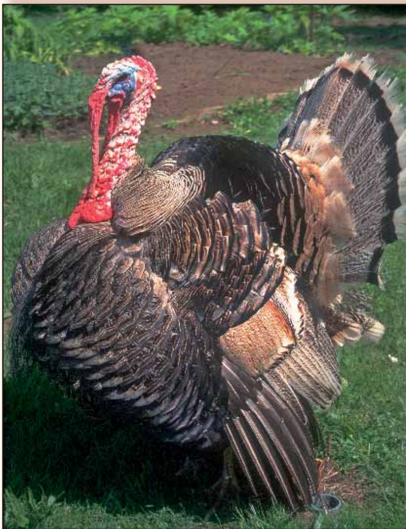
Nationaal kampioen 1995.

Een der eerste tentoongestelde hanen sinds de herontdekking.