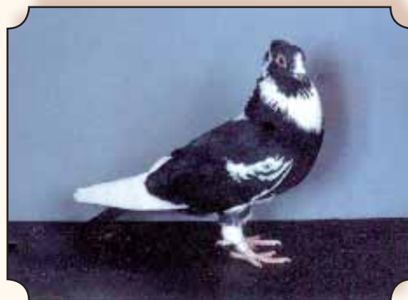
▲ Zwart. Fokker: J. Lauwers.

De meest voorkomende fouten op dit ogenblik zijn : te weinig borst, te lang type, te groot, slechte rugafdekking, schelpkap, orde-loze tekening.