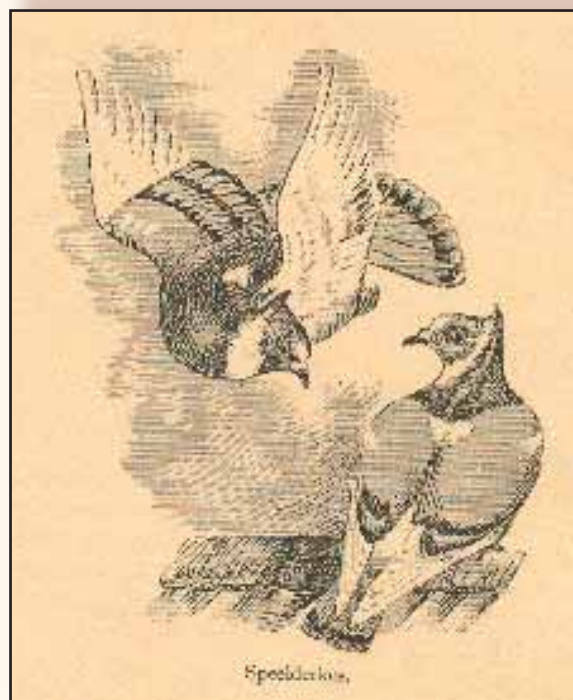
Tekening van ringslaande Speelderken uit het boek "Het Vlaamsch Neerhof" van 1895.

Door de jaren heen is het Speelderken steeds een eerder zeldzaam ras geweest. Toen ik in 1968 met Speelderken begon waren er nog amper een paar tiental te vinden en alleen in de blauwe kleurslag. Om de verdwenen kleurslagen zwart, blauwgekrast, rood, geel en roodzilvergeband terug te fokken heb ik zwartbonte en geelbonte Hollekropper ingekruist. Dit leek mij het best geschikte ras aangezien de oude Hollekropper betreft type en grootte zeer kort bij het Speelderken stond. Na een viertal jaren had ik het Speelderken terug in alle hogergenoemde kleurslagen. Toen ik in 1974 vijf Speelderken in blauw en rood instuurde op de Europaschau in Munchen schreef Christian Reichenbach in Geflügel-Börse " het