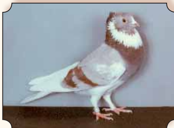
Roodzilver geband ► Fokker: J. Lauwers.

Wat de tekening betreft kan de keurmeester dus zeer soepel keuren aangezien punten 6 en 7 niet verplicht zijn en niet zichtbare schakelpennen en de kleur der duimveren geen rol spelen. Het allerhoogste predikaat kan alleen bij een volledige tekening.