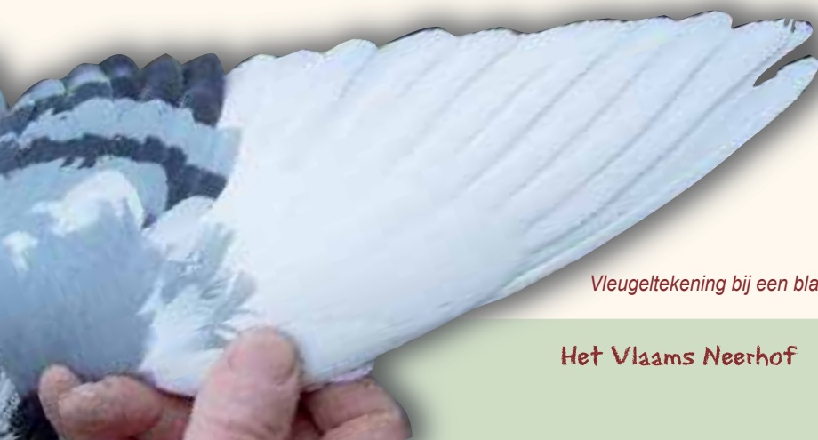
Vleugeltekening bij een blauw gebande.

De ogen kleuren van geel-oranje tot rood-oranje naargelang de kleurslag. De voorkeur gaat naar één of beide ogen gebroken. Liefst gebroken naar de bek toe wat de indruk geeft dat de duif scheel kijkt. Deze gebroken ogen komen sinds de kruisingen met andere ringslaande rassen minder en minder voor. De oogrand moet fijn zijn met een kleur in overeenstemming met het gevederte.