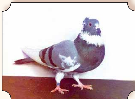
Blauw geband ► Fokker: J. Lauwers.

7. De harttekening tussen de schouders, is eigenlijk een driehoek die de nek tot basis heeft.