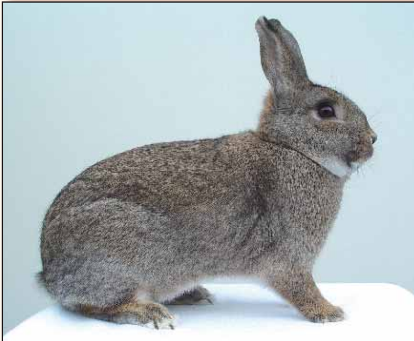
Konijngrijs met prima type en stelling ! Fokker: Alfons Vervloet.