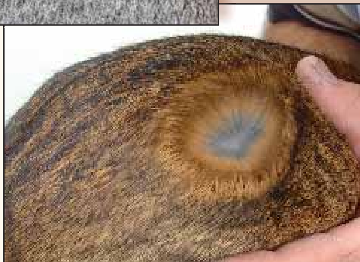
De grond- en tussenkleur bij konijngrijs en haaskleur.