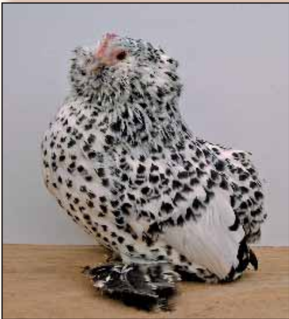
Een pronkstuk van de familie Muys. Dieren in nog niet erkende kleurslagen zoals deze zilverporselein hen kunnen best prachtig zijn indien de diertjes reeds de rastypische eigenschappen laten zien.

De kuikentjes zijn donsrijke, korte diertjes met een groot rond kopje. De staartloze kuikentjes kan je onmiddellijk herkennen, want bij hen voel je aan het uiteinde van de rug geen rechtopstaand "driehoekje", wat wel duidelijk te voelen is bij Ukkelse baardjes. Dit komt doordat enkele wervels aan het einde van de wervelkolom ontbreken.