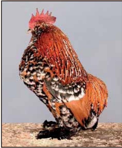
Everbergse baardkriel duizendkleur.