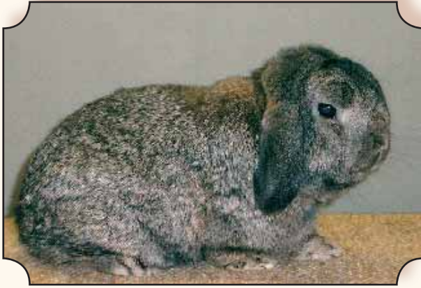
Nederlandse hangoordwerg, ijzergrauw.