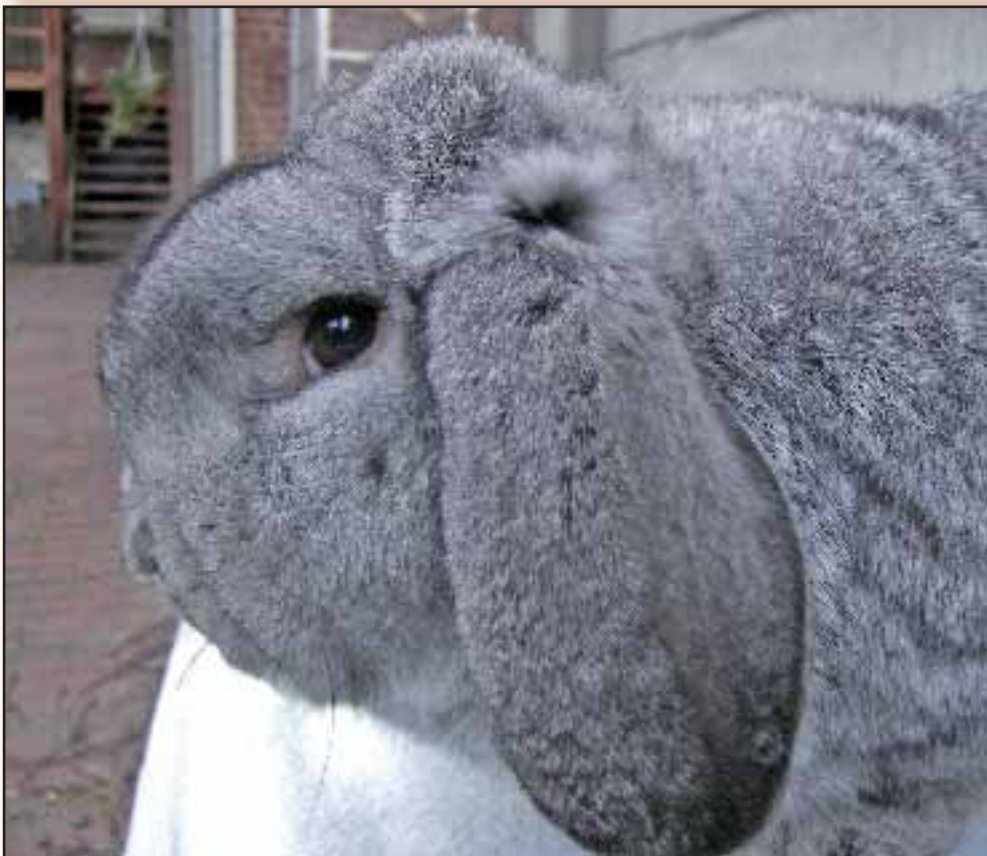
Kleine hangoor, chinchilla. Dit dier laat nog goed het onderscheid tussen de kronen en het voorhoofd zien.

Onze hangoren hebben de laatste 25 jaar zulke enorme evolutie ondergaan om het ideale standaardbeeld te evenaren dat de koppen steeds breder en ronder geworden zijn. Door het breder worden van de koppen, zijn de oren ook verder uit elkaar gaan staan en door de selectie op het hoefijzerbeeld gevormd door beide oren in vooraanzicht, is de inplanting van de oren ook meer naar de buitenkant gaan staan. De oren van onze moderne konijnen ondervinden tegenwoordig geen enkele hinder meer om mooi naar beneden te hangen. Ik kan u verzekeren dat de jonge konijntjes die aan 15 dagen hun eerste stapen uit het nest maken, bij mij met afhangende oren te voorschijn komen. Dit bewijst het grote verschil tegenover 25 jaar geleden toen men drie maanden moest wachten om de oren te zien vallen, terwijl ze nu bij de meeste jonge dieren op twee weken ouderdom reeds mooi naar beneden hangen. Dit is ook de leeftijd dat wij het best onze jonge dieren kunnen selecteren op hun goede en minder goede eigenschappen. Bij een diertje dat aan die leeftijd