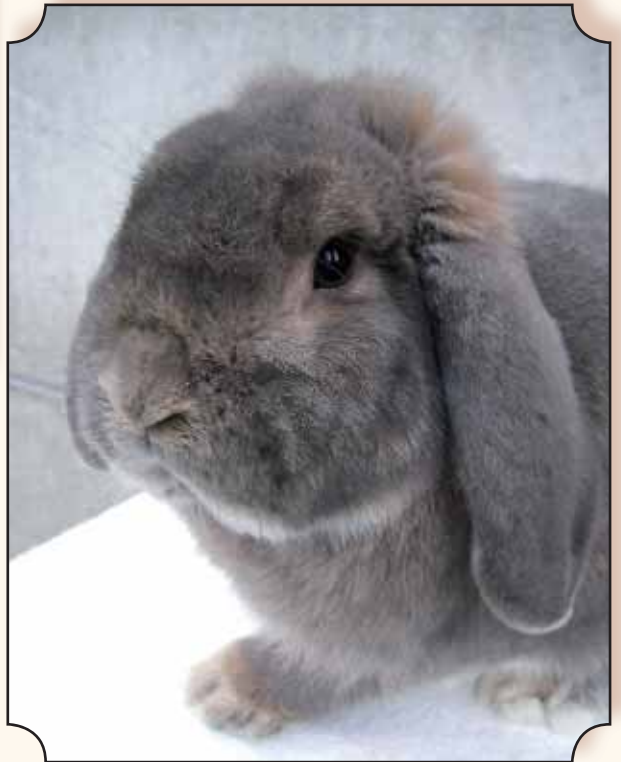
Kleine hangoor, blauwgrijs.