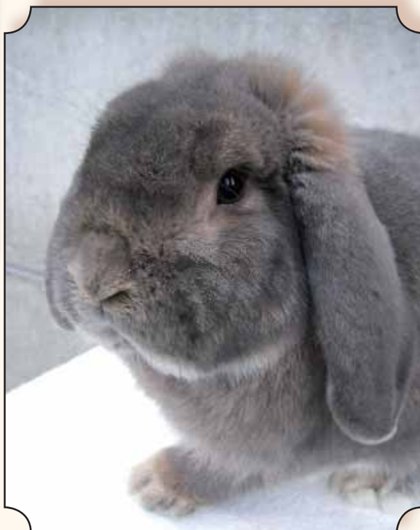
Kleine hangoor, blauwgrijs.