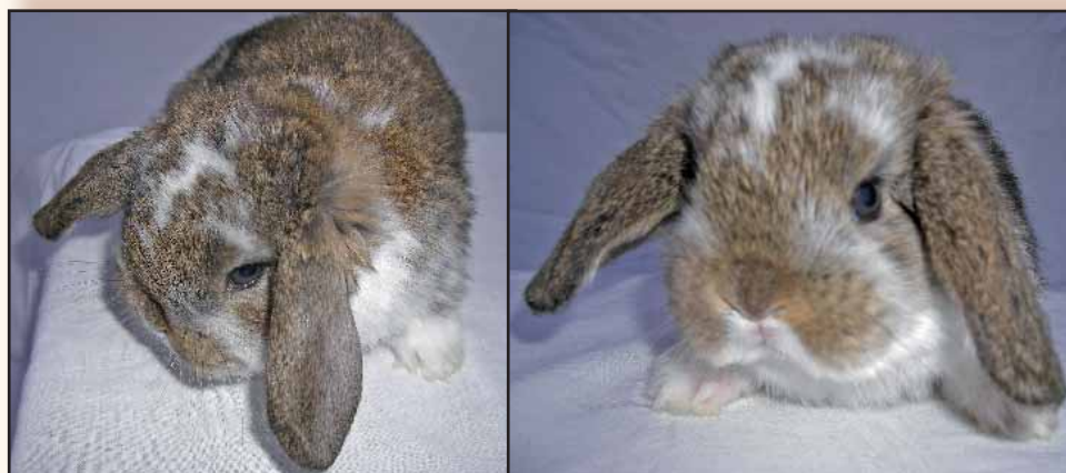
Kleine hangoor, jong konijngrijs-bont van 22 dagen.

Ik meen te mogen stellen dat de fokkers, maar zeker ook de keurmeesters die minder ervaring hebben met de hangoor konijnen, niet meer moeten zoeken naar de kronen, gevormd door twee bulten op de schedel van de konijnen, want dit is definitief verleden tijd. Als men dat terug wil moet men de evolutie 25 jaar achteruit draaien, hetgeen zeker de bedoeling niet kan zijn.