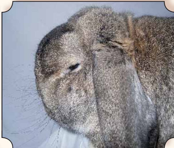
Kleine hangoor, konijngrijs.