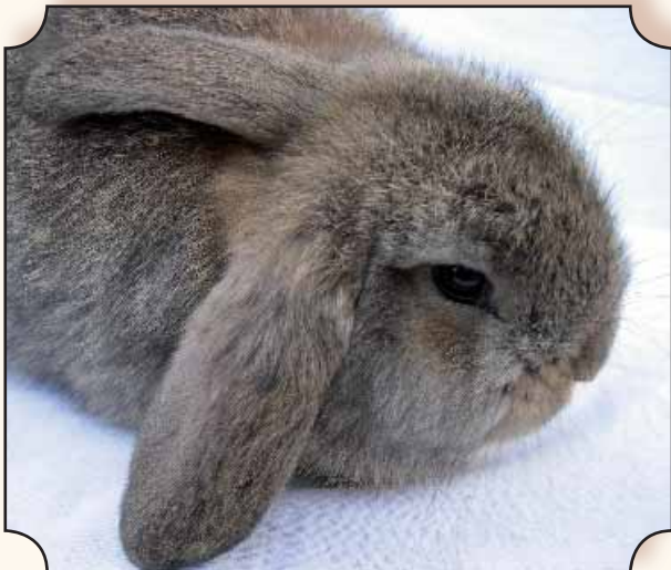
Jong konijngrijs van 1 maand dat uitzonderlijk maar één oor laat hangen, het andere rust op de rug