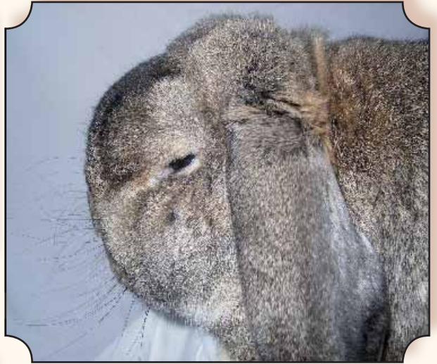
Kleine hangoor, koninggrijs.