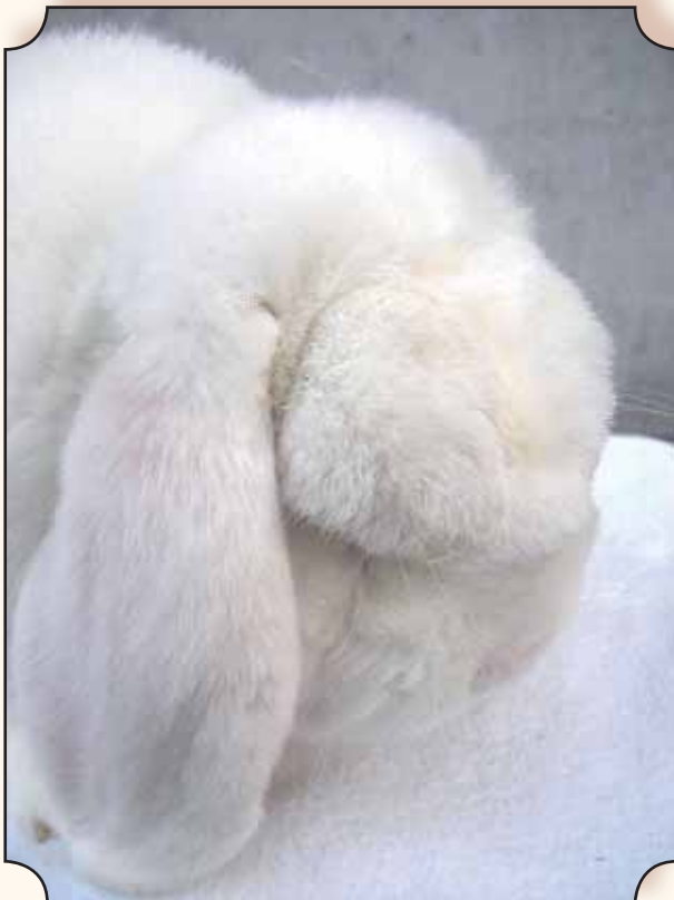
Kleine hangoor, wit roodoog.