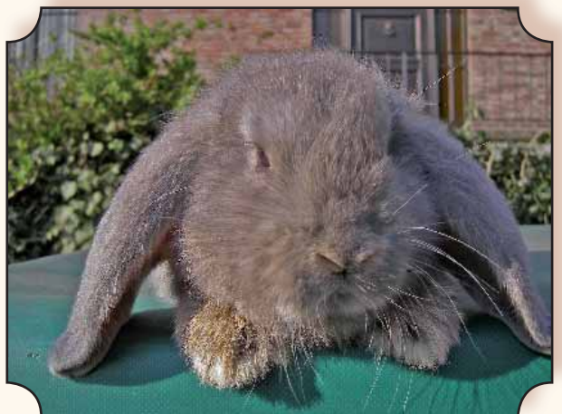
Kleine hangoor, blauwgrijs van 2 maanden.