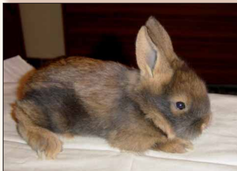
Jong Gents baardkonijntje van 9 dagen oud.

Op een leeftijd van 3 maanden blijkt de lengte van de wollige beharing nog steeds toe te nemen, zowel op de flanken, als op de kop en in de hals – en nekstreek. Rond deze leeftijd is de beharing het meest uitgesproken, maar de groei zal nog enkele maanden aanhouden. Daarna, tot 6 maanden ouderdom, is de evolutie omgekeerd: de lange wollige beharing zal terug afnemen. Bij oudere voedsters kan de kenmerkende wollige beharing terug toenemen. De kleur van de wollige baard kan van grijsblauw tot zwart variëren. De beharing op de voetzolen en staart is net iets langer dan de beharing van konijnen met een normale beharing.