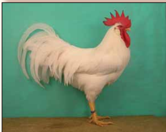
Zeer typische Italiënerhaan met 97 te Leipzig 2006.

Daarmee was het probleem niet opgelost, integendeel de zaak werd alleen maar gecompliceerder. Theoretisch werden beide types geacht gelijk te zijn maar de praktijk is zeker anders. Vooral de beschrijving op papier van het Duitse type wijkt nogal sterk af van de werkelijkheid. Bovendien ijvert de Nederlandse Leghornclub (en ook terecht) voor het behoud van het eigen standaardideaal en is er momenteel zeker geen toenadering tussen de beide types. De vraag is dus maar of de verschillen ooit zullen worden weggewerkt. Intussen werden onze Belgische keurmeesters wel geconfronteerd met twee verschillende types op onze tentoonstellingen en daarnaast ook nog alle mogelijke tus-