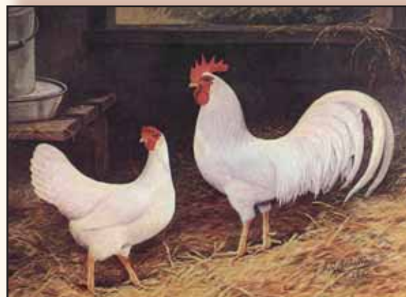
Koppel Amerikaanse Leghorns

Wat betekende dat alles nu op tentoonstellingsniveau in ons land ? Wel in België werden tot 2004 vier verschillende 'types' erkend, nl. het Amerikaanse, het Engelse, het Nederlandse en het Duitse. Toen in 2004 de vernieuwde standaardcommissie hoenders begon met het opstellen van uniforme lijsten in de beide landstalen van erkende rassen en kleurslagen, werd besloten om het idee van één ras met vier 'types' te verlaten en voortaan van te spreken van vier afzonderlijke rassen. De tijd had er immers voor gezorgd dat de 'types' zodanig geëvolueerd waren dat sommige zo verschillend waren dat het niet meer verantwoord was om nog van één ras te spreken. Het grote probleem echter was dat België als enige land in Europa nog een Nederlands en een Duits type kende. Voor de Europese Entente waren deze beide identiek. Ook Nederland had intussen het Duitse type opgegeven en stemde ermee in dat het Nederlandse standaardtype op Europashows Italiëner zou genoemd worden. Dit alles werd besproken op de Europese studiedagen voor hoenderkeurmeesters in Heviz (Hongarije) waar ons land voor het eerst sinds lang opnieuw aan deelnam. Het afschaffen van de types en het invoeren van afzonderlijke rassen werd er bevestigd en op dit ogenblik spreekt alleen Nederland nog van verschillende types.