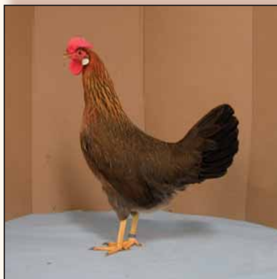
Patrijs Livornohen uit Italië. Op de foto is de houding iets te opgericht.