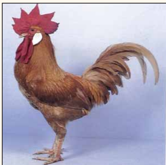
Engelse Leghornhaan buff. © British Poultry Standards 1997