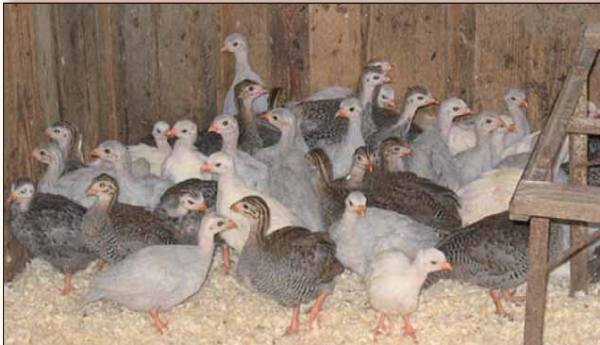
Kuikens van verschillende kleurslagen.