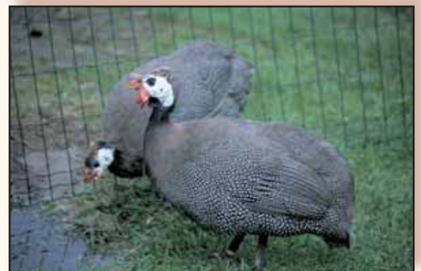
Koppel wildkeurige met mooie donkere pootkleur.

Tamme parelhoenders worden meestal gehouden voor hun smakelijke en fijne vlees. Vooral in Frankrijk worden ze daarom nog massaal gekweekt. Ook bij ons kan men ze in het voorjaar en de zomer gemakkelijk vinden op pluimveemarkten en bij verkopers van gebruikspluimvee.