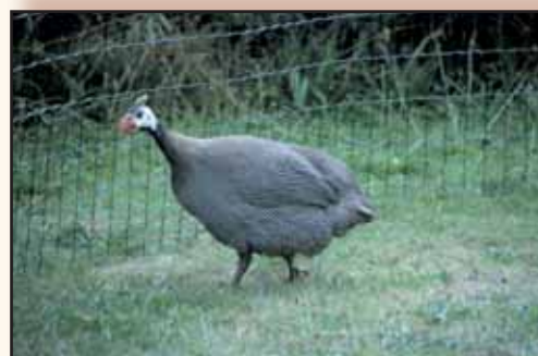
Mooie forse wildkleur.

Daarnaast kan men trachten het geslacht te bepalen aan de kopversierselen maar deze manier is minder zeker dan de eerste twee methodes. Normaal is de helm van de hen niet zo groot en wijst schuin naar achter.