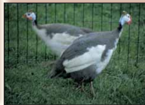
Wildkleur witborst koppel.