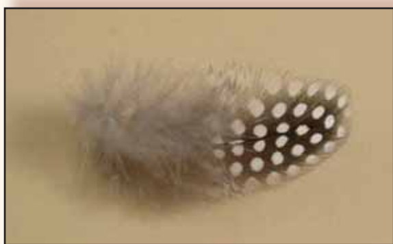
Detail van de pareltekening op een borstveer.

Net zoals de kalkoen heeft het parelhoen een kop die bij de meesten niet in de smaak valt. Toegegeven dat de kop iets prehistorisch heeft en er zijn minst ongewoon uit ziet maar de sterk contrasterende kleuren van de witte kopvleugel met de felgekleurde kopversierselen en de halsbevedering zorgt voor een fraai kleurenspeel, zeker op een groene achtergrond. De kop