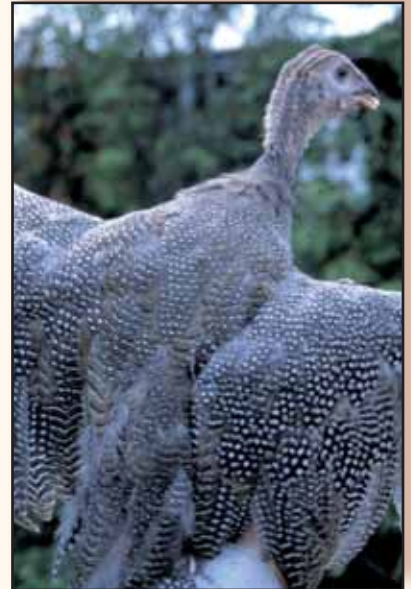
De pareltekening komt tevoorschijn.

Indien men wil fokken, is het raadzaam om slechts één haan bij de hennen te laten lopen. Zijn het er twee, dan zijn deze vaak continu met elkaar aan het kibbelen (dit zijn geen gevechten op leven en dood) en vergeten ze eigenlijk met de hennen te paren. Indien er drie hanen aanwezig zijn, zijn de resultaten vaak beter want als 2 honden vechten om een been... De hennen beginnen in het voorjaar (meestal einde maart) te leggen en gaan daar normaal mee door tot in de herfst. Meestal zullen ze trachten de eieren te verstoppen in een eenvoudig nest dat vaak door meerdere hennen gebruikt wordt. Het is niet onge-woon om in het seizoen goed verstopte nesten met daarin tientallen eieren aan te treffen. Deze eieren zijn bruin van kleur en niet al te groot (ongeveer 45g). Ze hebben wel een typische vorm. De bolle kant is zeer kort en de tegenover-gestelde zijde is veel langer en vrij spits. Ook kenmerkend is de zeer sterke en dikke schaal en de grote dooier in verhouding tot de eigrooite. Het uitbroeden van de eieren doet men best machinaal want de hennen zijn niet altijd de