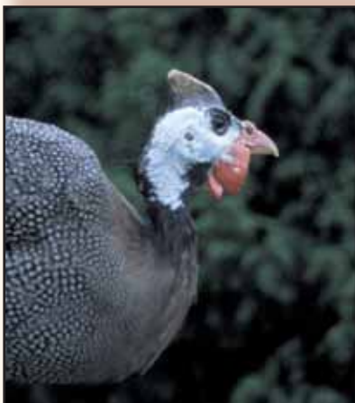
Kopstudie van een wildkleurige hen.

Parelhoenders kunnen zonder probleem samengehouden worden met andere neerhofdieren. Wanneer de ruimte voldoende groot is en ze zich kunnen afzonderen dan gaat dat zeer vreedzaam. Is de ruimte beperkt dan zullen de hanen zich ontpoppen tot echte macho's die absoluut de baas willen spelen op het erf en meestal het laatste woord moeten hebben. Ze voeren daarbij vaak aanvallen in de rug uit op hun