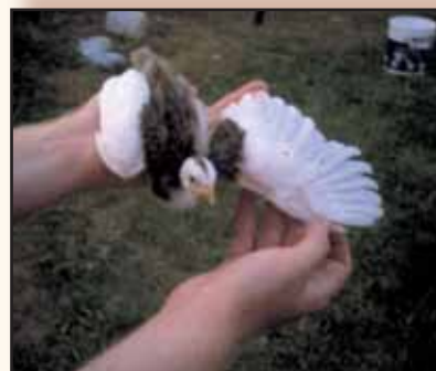
Witborst kuiken met perfecte tekening.

Het is jammer dat we van al deze kleurenpracht zo weinig te zien krijgen op onze tentoonstellingen want het is bijna de enige manier om het grotere publiek er kennis mee te laten maken. Hopelijk kan dit artikel ertoe bijdragen om de interesse voor deze ondergewaardeerde vogel weer een beetje aan te wakkeren. Wie er echter mee zou willen beginnen, zal het moeilijk hebben om nog goed startmateriaal te vinden in ons land, zeker in de speciale kleurslagen. Het beste materiaal is ongetwijfeld te vinden in Duitsland waar men regelmatig nog eens een mooie collectie kan bewonderen.